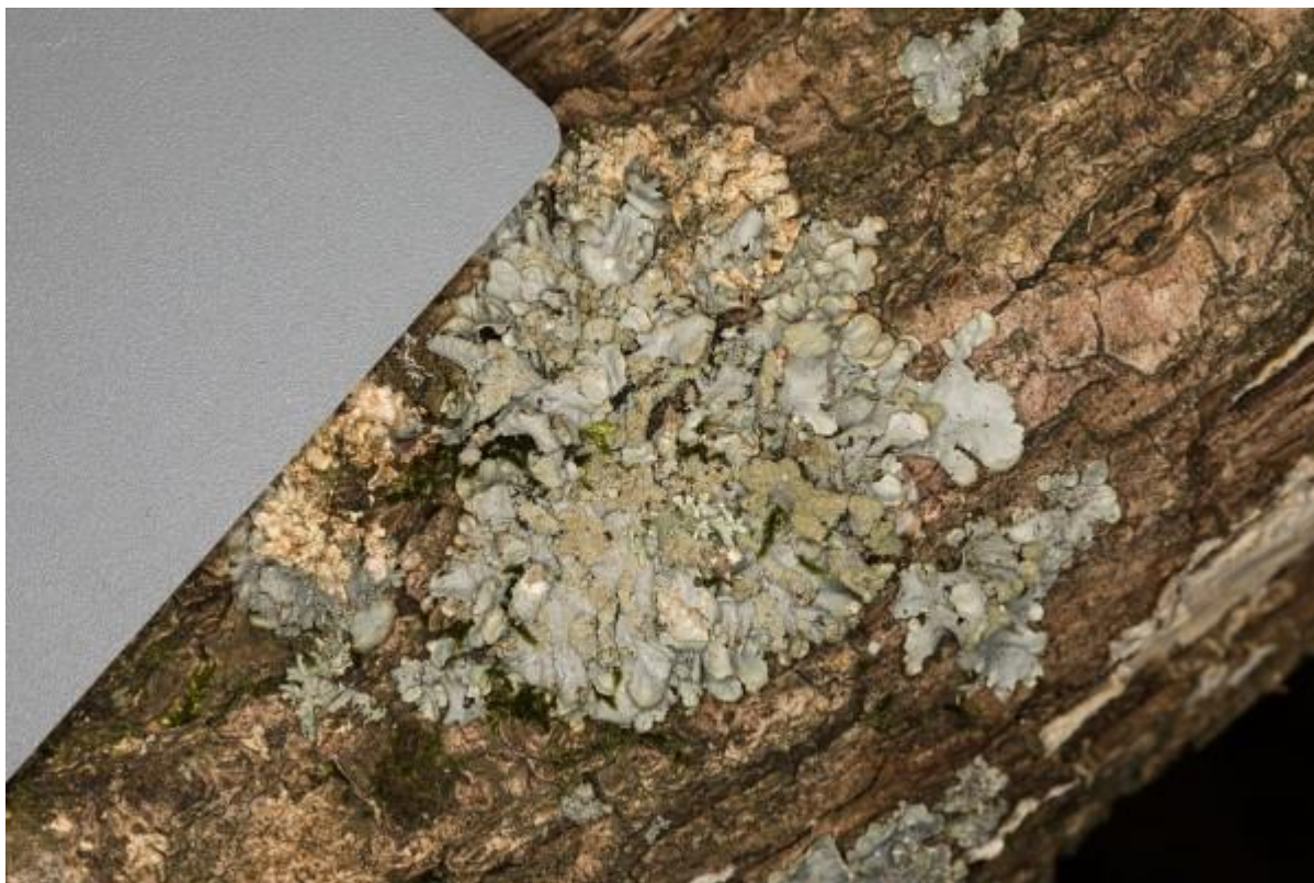
Grof gebogen schildmos